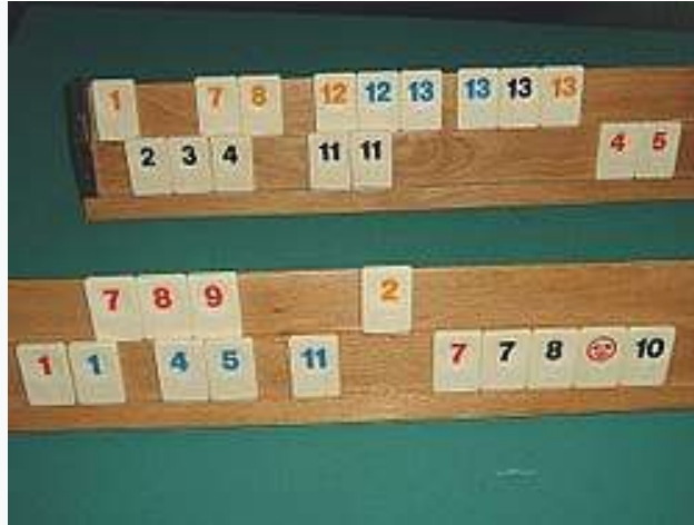
Pelaajat säilyttävät käyttämättömiä laattoja telineissä.