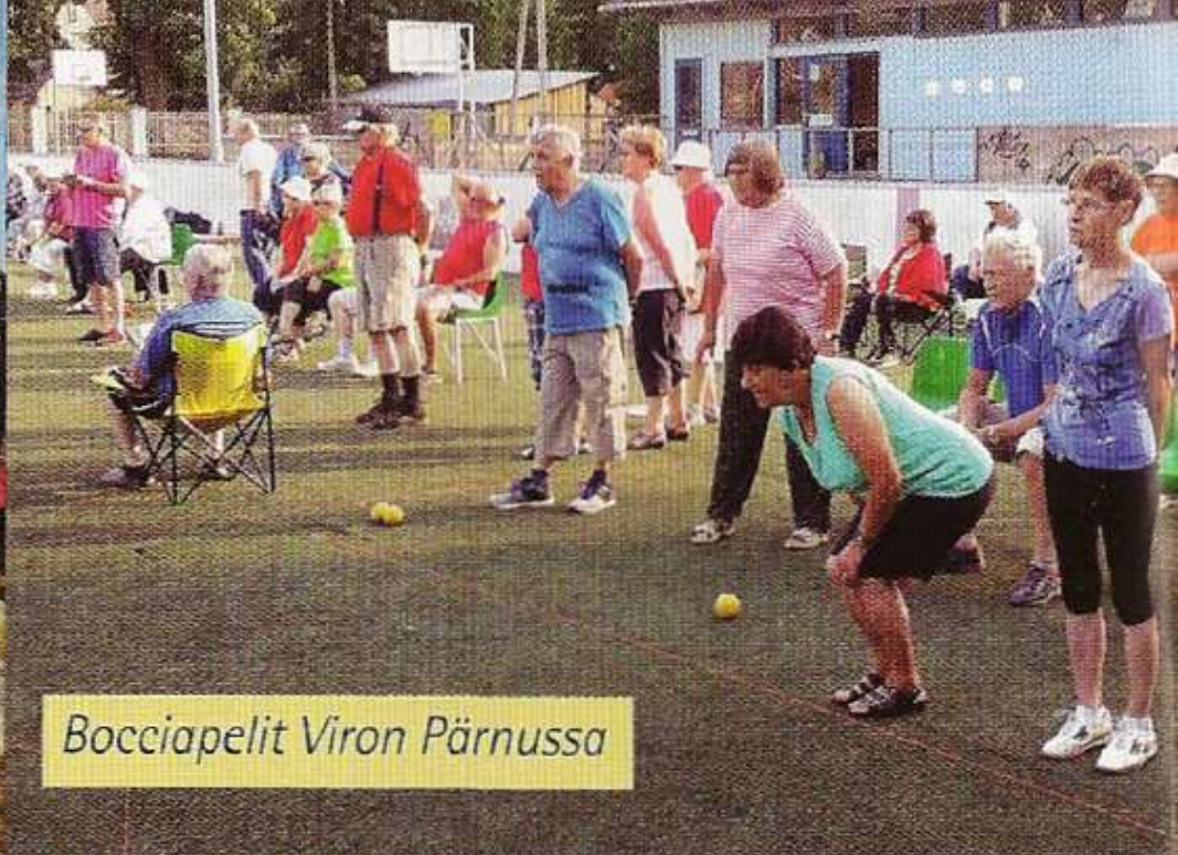
Bocciapelit Viron Pärnussa